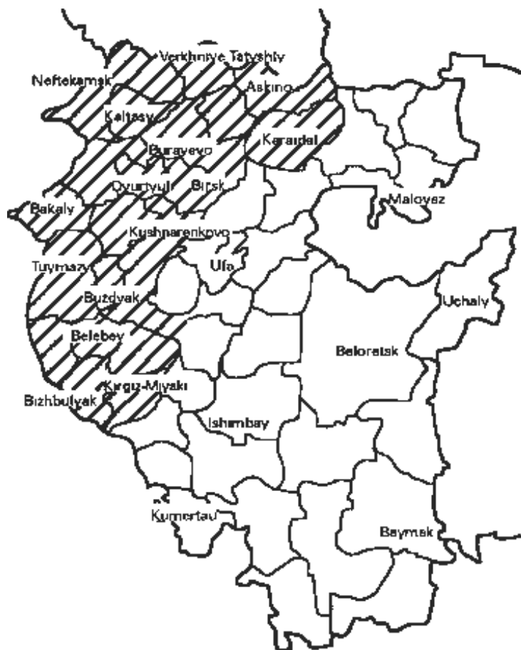
Табл. 1. Родной язык башкир Башкортостана (%)